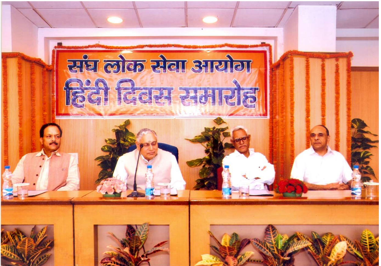
14 सितम्बर, 2017 को आयोग में आयोजित "हिंदी दिवस" समारोह।